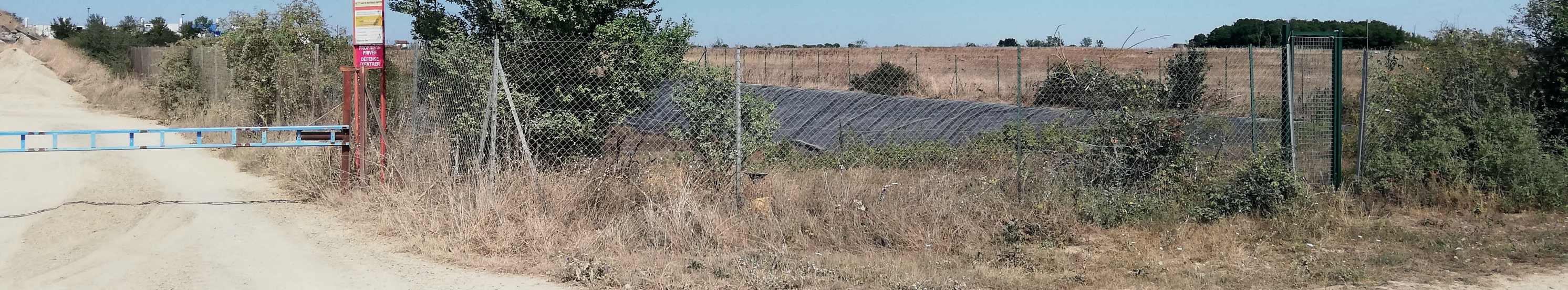
PC6a - Existant