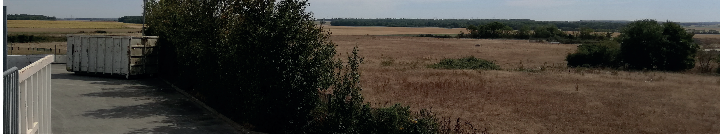
PC6b - Existant