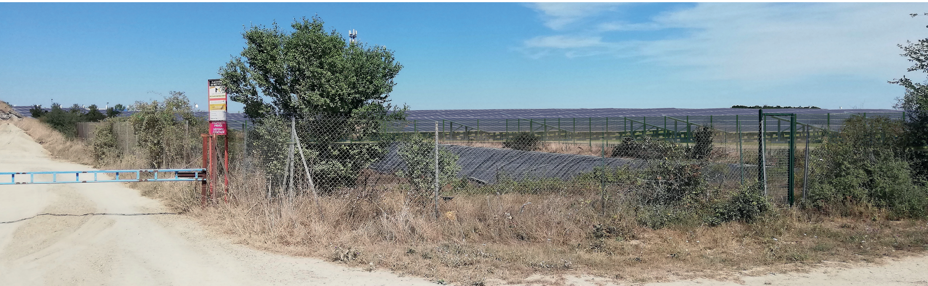
PC6a - Projeté