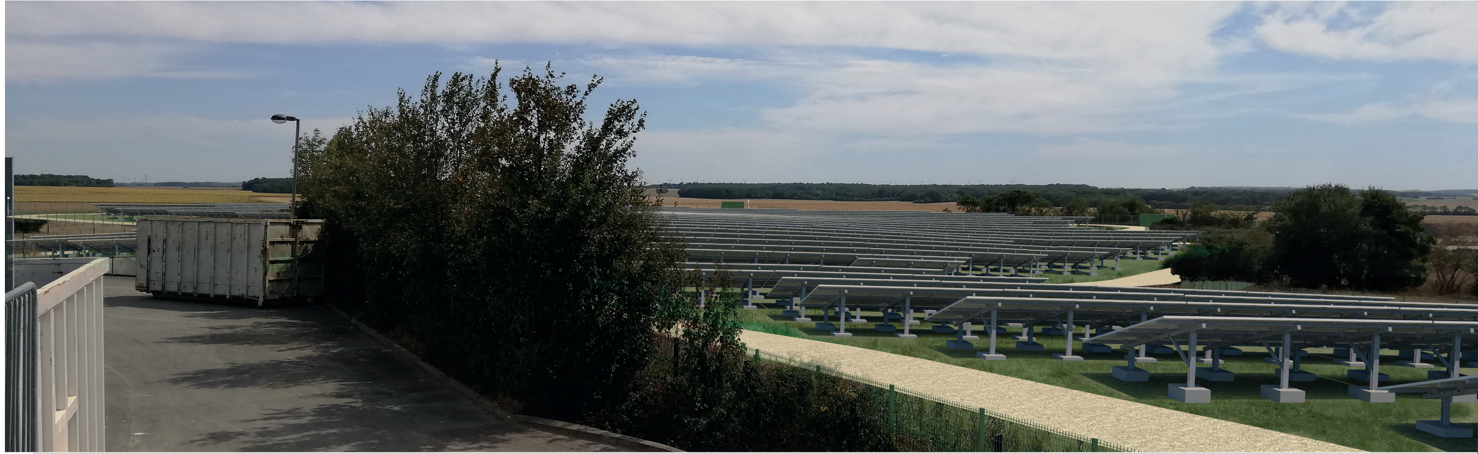
PC6b - Projeté